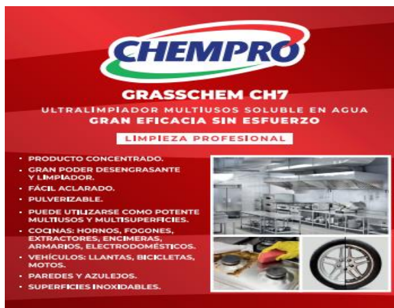
Antes de la aplicación

Ultralimpiador multiusos soluble en agua.